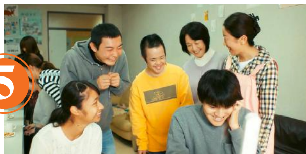
TALKING TO THE STARRY SKY de Yurugu Matsumoto Japon 1h54

Lors du tremblement de terre du Japon en 2011, causant la disparition de plus de 18 000 personnes, le taux de mortalité des personnes handicapées a été deux fois plus élevé que celui des personnes valides. Le film dépeint cette réalité à travers des histoires de témoins dont les récits ont été recueillis dans les zones touchées. ★