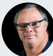
Pascal DUQUENNE , acteur, Membre permanent du jury Prix spécial Pascal Duquenne