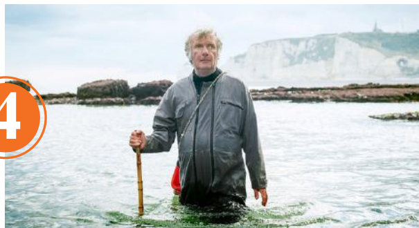
LA SAISON DES TOURTEAUX de Martin Benoist France 52 mn

Derrière la falaise d'Étretat, Christophe, malvoyant profond, pêche « à la tête » tourteaux et homards, dans un espace quasi lunaire, où personne ne s'aventure. À ses côtés, nous faisons l'expérience de ce que Christophe ressent, à commencer par la beauté de ce paysage. ★